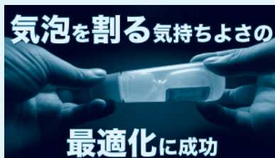
遊べる文具 - 気泡わり専用液状のり