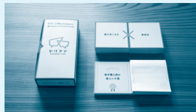
アイデア発想カードゲーム - かけアイ