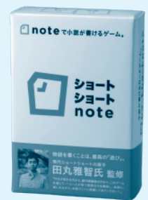
ショートショートnote