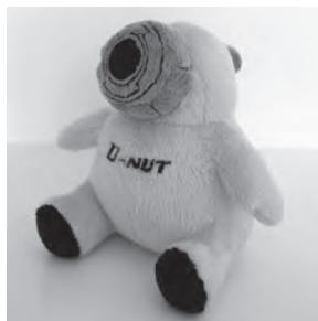
株式会社富士精密 広報担当者

1971年 大阪生まれ。大阪府立大学大学院 経営学研究科修了（経営学修士）。2008 年に株式会社電子技販 代表取締役に就任。幼少期よりプリント基板の造形美に魅了され、「基板とは完璧に計算された芸術である」という理念のもと、2014 年に基板アート雑貨ブランド「moeco」を立ち上げる。デザイン性と技術力を融合させたプロダクトが話題となり、同社の知名度向上に大きく貢献。現在では、20 代社員が正社員の半数を占めるなど、次世代人材の採用・定着にも成功している。